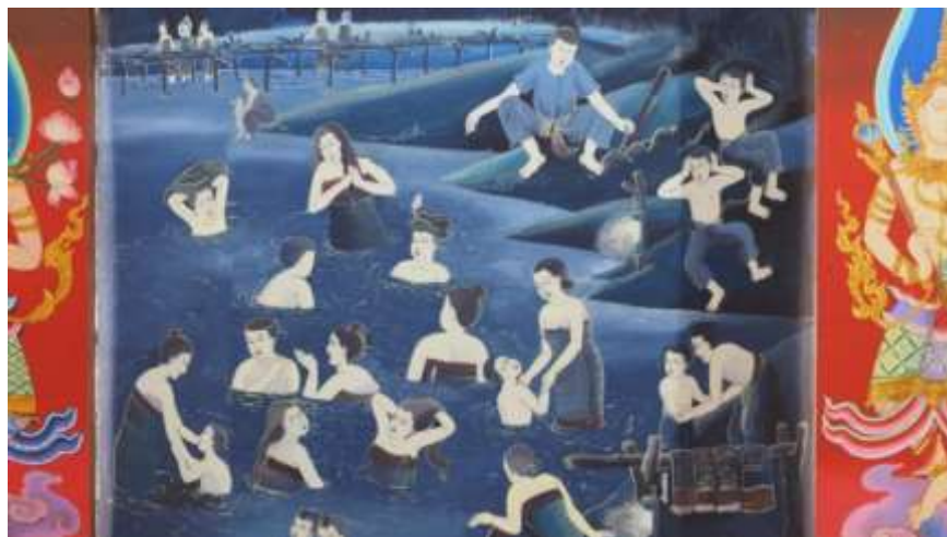
ภาพที่ 5 จิตรกรรมภาพประเพณีงานสงกรานต์

1. การวิเคราะห์คุณภาพของการพัฒนาสื่อสารสนเทศทางศิลปวัฒนธรรมและภูมิปัญญาที่ซ่อนอยู่ในภาพจิตรกรรมฝาผนังพระอุโบสถบนเส้นทางพระร่วง จังหวัดสุโขทัย พบว่า ผลการประเมินในภาพรวมอยู่ในระดับมากที่สุด ค่าเฉลี่ยเท่ากับ 4.53 และค่าส่วนเบี่ยงเบนมาตรฐาน 0.12 ดังตารางที่ 1