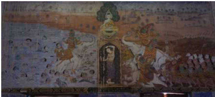
ภาพที่ 1 จิตรกรรมภาพตอนมารผจญ ในพระอุโบสถ วัดหนองไฉ่

จากการวิจัยสามารถสรุปได้ว่า ภาพจิตรกรรมฝาผนังพระอุโบสถบนเส้นทางพระร่วง จังหวัดสุโขทัย ซึ่งประกอบด้วย วัดดลิ่งชัน วัดโบสถ์มณีราม และวัดหนองไฉ่ จะสามารถแบ่งผลงานภาพจิตรกรรมออกเป็น 3 ส่วน คือ ส่วนแรกมีลักษณะภาพเขียนที่บอกเล่าเรื่องราวเกี่ยวกับพุทธประวัติที่สำคัญ ได้แก่ ภาพผจญมาร (ภาพที่ 1) ภาพตอนดับขันธปรินิพพาน (ภาพที่ 2) ส่วนที่สอง เป็นคติธรรมคำสั่งสอนของพระพุทธเจ้า วรรณคดี รามเกียรติ์ ได้แก่ ภาพเหล่าเทวดามาฟังธรรมของพระพุทธเจ้า ภาพวรรณคดี เรื่องทรพีทรพา ภาพรามเกียรติ์ หลวิชัยคาสี (ภาพที่ 3) ส่วนที่สามเป็นวิถีชีวิต ประเพณีต่าง ๆ โดยใช้ภูมิปัญญาชาวบ้านในการสร้างสรรค์ผลงาน ได้แก่ ภาพประเพณีแห่ช้างบวชนาค ภาพประเพณีสงกรานต์ ภาพประเพณีกำฟ้า (ภาพที่ 4 และภาพที่ 5) ไว้อย่างสวยงาม