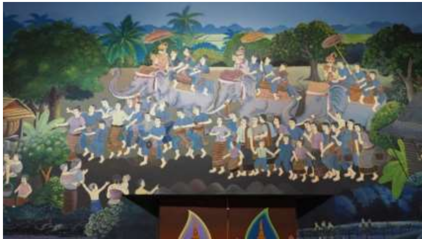
ภาพที่ 4 ภาพจิตรกรรมงานประเพณีแห่ช้างบวชนาค