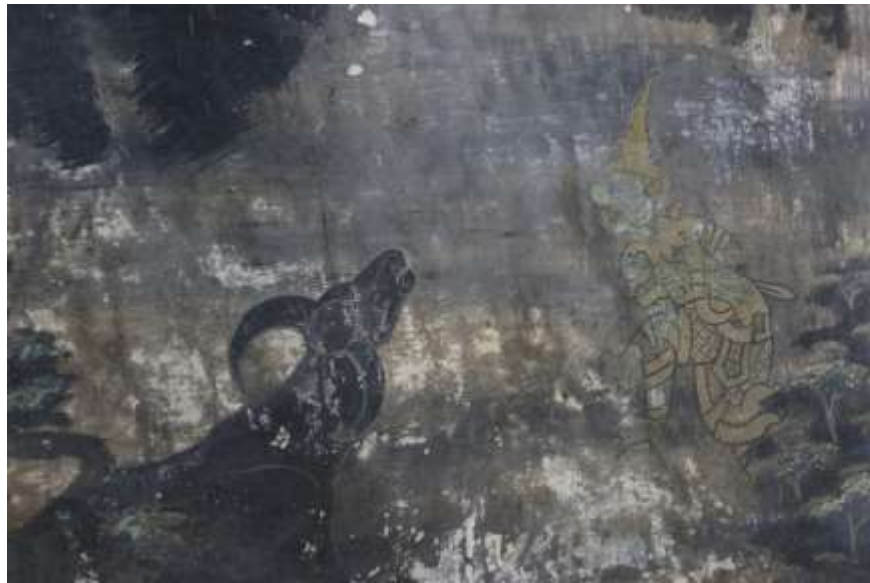
ภาพที่ 3 จิตรกรรมภาพรามเกียรติ์ เรื่อง ทรพี ทรพา