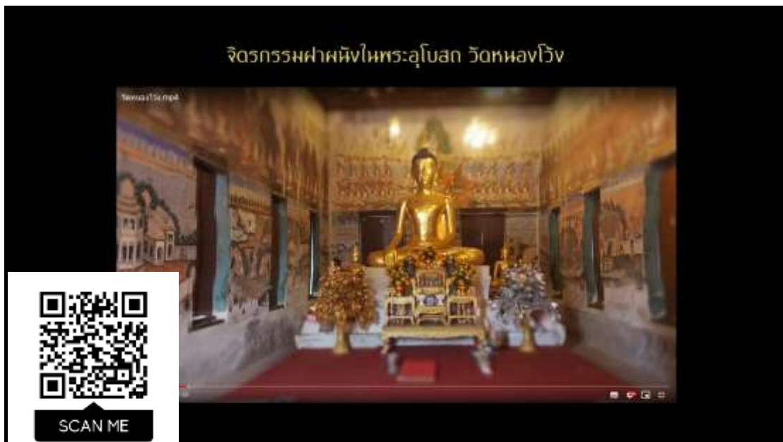
ภาพที่ 3 วิดีทัศน์สื่อสารสนเทศจิตรกรรมฝาผนังพระอุโบสถวัดหนองไ้