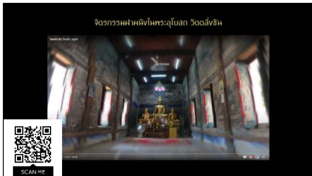
ภาพที่ 1 วีดิทัศน์สื่อสารสนเทศจิตรกรรมฝาผนังพระอุโบสถวัดดิ่งชัน

โดยการจัดทำสื่อวีดิทัศน์ในการเผยแพร่เรื่องราวภาพจิตรกรรมฝาผนังบุคคลทั่วไปสามารถเข้าถึงและค้นหาข้อมูลจิตรกรรมฝาผนังในสื่อสารสนเทศอิเล็กทรอนิกส์ทางระบบออนไลน์บนเครือข่ายอินเทอร์เน็ตผ่านอุปกรณ์คอมพิวเตอร์