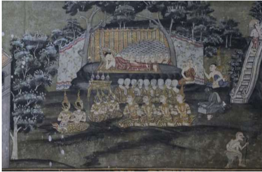
ภาพที่ 2 จิตรกรรมภาพพระพุทธเจ้าเสด็จดับขันธปรินิพพาน