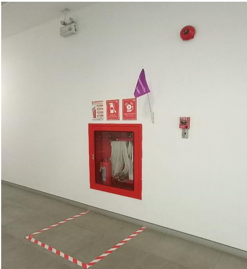
บริเวณ ชั้น 3 โซน A