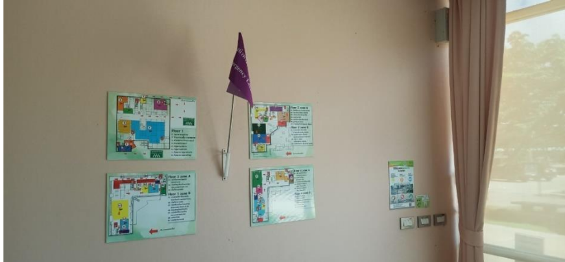
ห้องสำนักงานผู้อำนวยการ