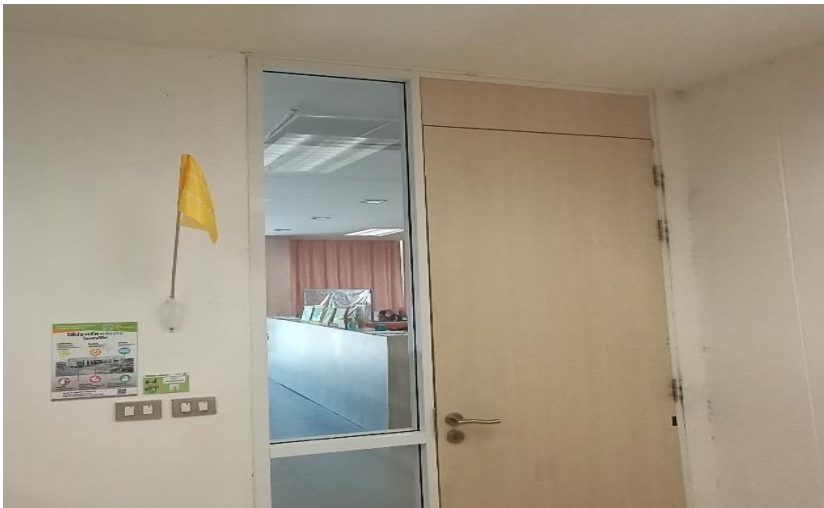
ห้องงานเทคนิคสารสนเทศ