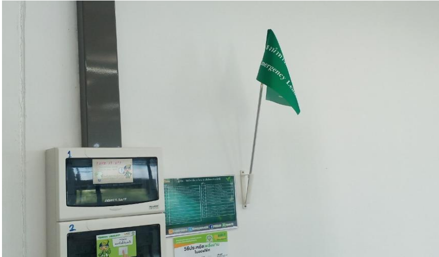
เคาน์เตอร์ บริการของห้องศึกษาค้นคว้ากลุ่ม