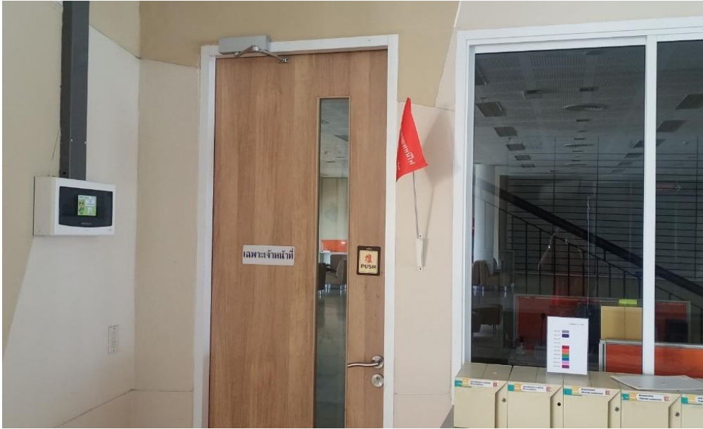
เคาน์เตอร์บริการสื่อสตัทสน์

5.5.1 (8) มีการกำหนดทางออกฉุกเฉิน ทางหนีไฟ พร้อมมีป้ายแสดงอย่างชัดเจน