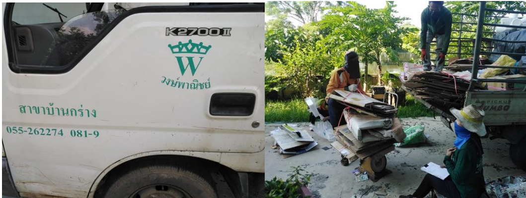
ภาพการจำหน่ายให้กับผู้รับซื้อของเก่าที่มีใบอนุญาตในการประกอบกิจการ

ขยะรีไซเคิล ได้แก่ ขวดพลาสติก ขวดแก้ว กระดาษ กล่องกระดาษลัง สำนักวิทยบริการและเทคโนโลยีสารสนเทศ ได้มีการคัดแยกเพื่อจำหน่ายให้กับ วงษ์พาณิชย์ เป็นกิจการรีไซเคิลขยะแห่งประเทศไทยที่ได้รับการรับรองมาตรฐานการจัดการสิ่งแวดล้อม ISO 14001 และรางวัลอุตสาหกรรมดีเด่นประเภทการบริหารอุตสาหกรรมขนาดกลางและขนาดย่อมในปี 2544 จากผู้สร้างกระแสอนุรักษ์สิ่งแวดล้อมด้วยการคัดแยกขยะเพื่อรีไซเคิลให้เกิดขึ้นในระดับจังหวัดที่เมืองพิษณุโลก ทั้งนี้กำหนดไว้เดือนละ 1 ครั้ง หรือตามปริมาณที่สำรวจ หากพบมีปริมาณมาก จะเรียกกรมารับก่อนรอบ