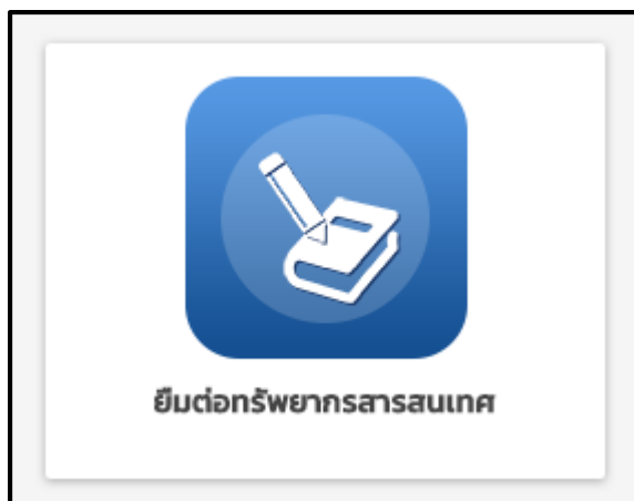
ภาพที่ 1 เมนูยืมต่อทรัพยากรสารสนเทศ