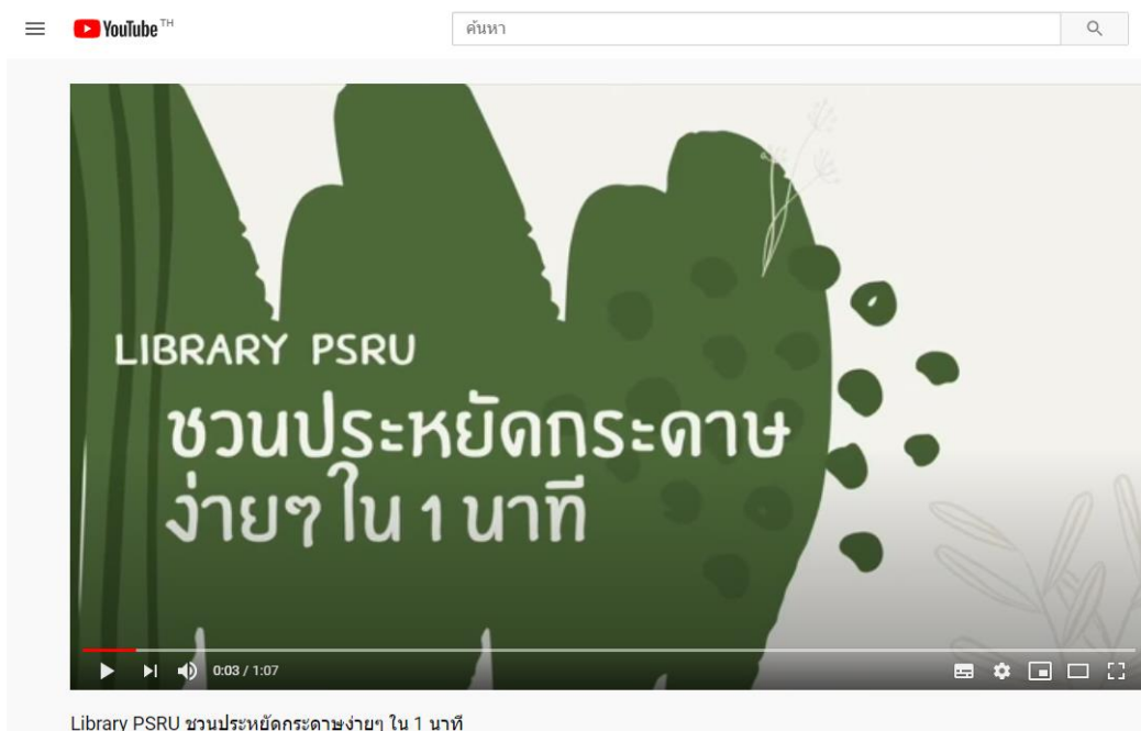
Library PSRU ขวนประหยัดกระดาษง่ายๆ ใน 1 นาที