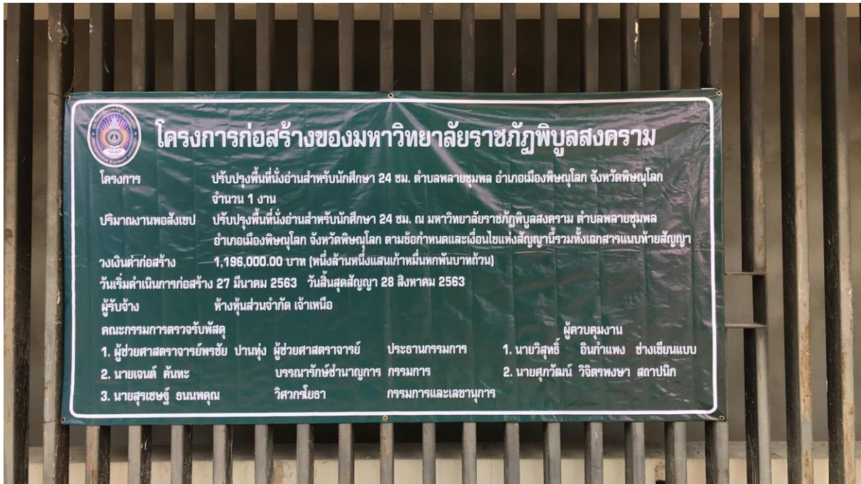
ภาพถ่ายการปรับปรุงพื้นที่นั่งอ่านสำหรับนักศึกษา 24 ชั่วโมง