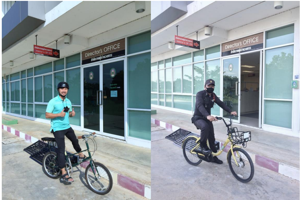
ภาพที่ 8 สนับสนุนให้บุคลากรใช้จักรยานมาทำงาน หรือใช้ติดต่อประสานงานกันระหว่างหน่วยงานภายในมหาวิทยาลัย