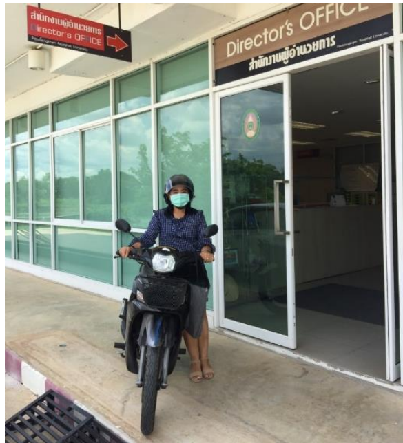
ภาพที่ 3 กำหนดเวลาในการรับส่งเอกสารโดยรถจักรยานยนต์ในแต่ละวัน โดยรวบรวมเอกสารไว้จัดส่งพร้อมกัน โดยกำหนดรับส่ง วันละ 2 รอบ คือ รอบเช้าใน เวลา 08.30 น. และรอบบ่าย เวลา 14.30 น.