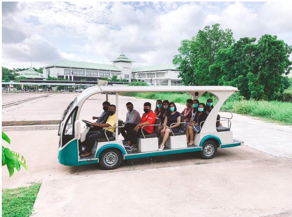
ภาพที่ 9 ใช้ระบบการขนส่งด้วยรถไฟฟ้าภายใน มหาวิทยาลัยในกรณีไปประชุม ณ หน่วยงานอื่นๆ ภายในมหาวิทยาลัย