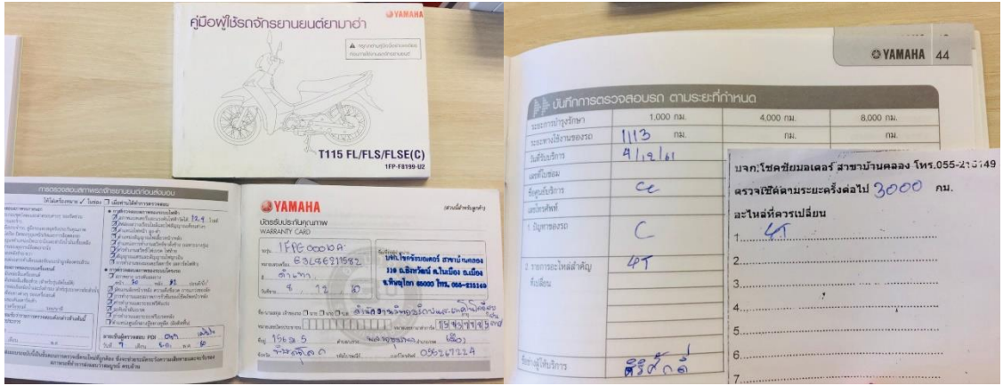
ภาพที่ 5 มีการดูแลรักษารถจักรยานเป็นประจำ ตรวจเช็คตามระยะเวลาที่กำหนด