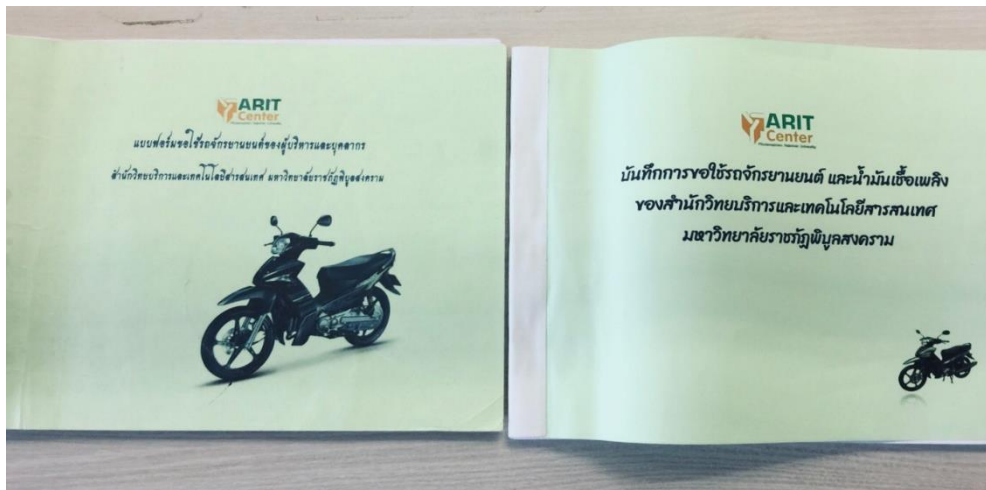
ภาพที่ 6 มีบันทึกการขอใช้รถจักรยานยนต์ และน้ำมันเชื้อเพลิงของสำนักวิทยบริการฯ