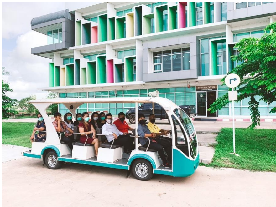
ภาพที่ 4 มีการวางแผนการเดินทาง หากเดินทางไปในสถานที่เดียวกัน โดยใช้รถไฟฟ้าของมหาวิทยาลัย เช่น การประชุมบุคลากรประจำปี ภายในมหาวิทยาลัย เป็นต้น