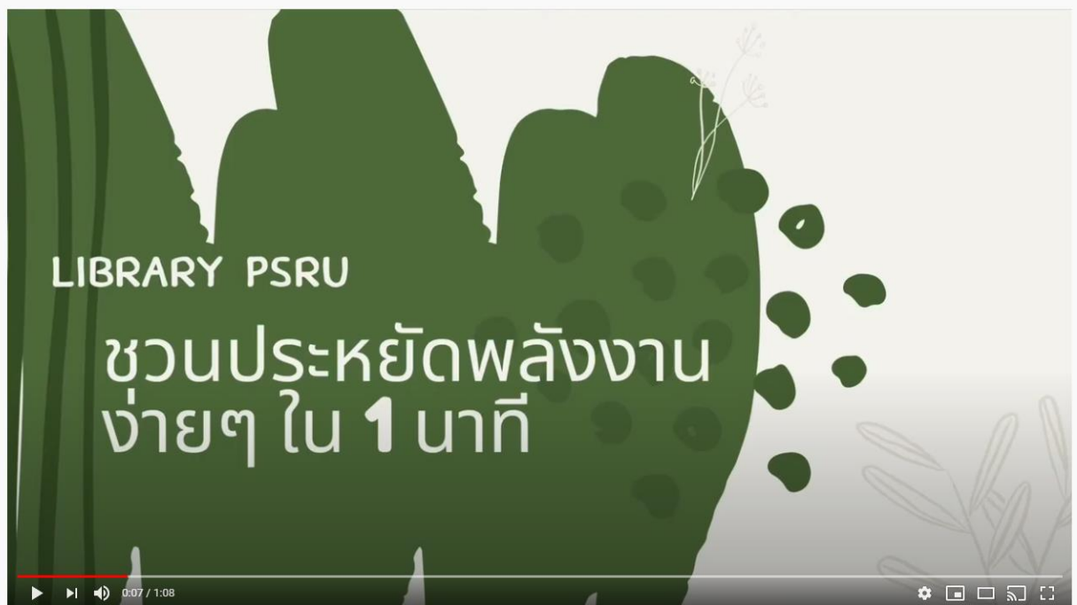
Library PSRU ชวนประหยัดพลังงานง่ายๆ ใน 1 นาที